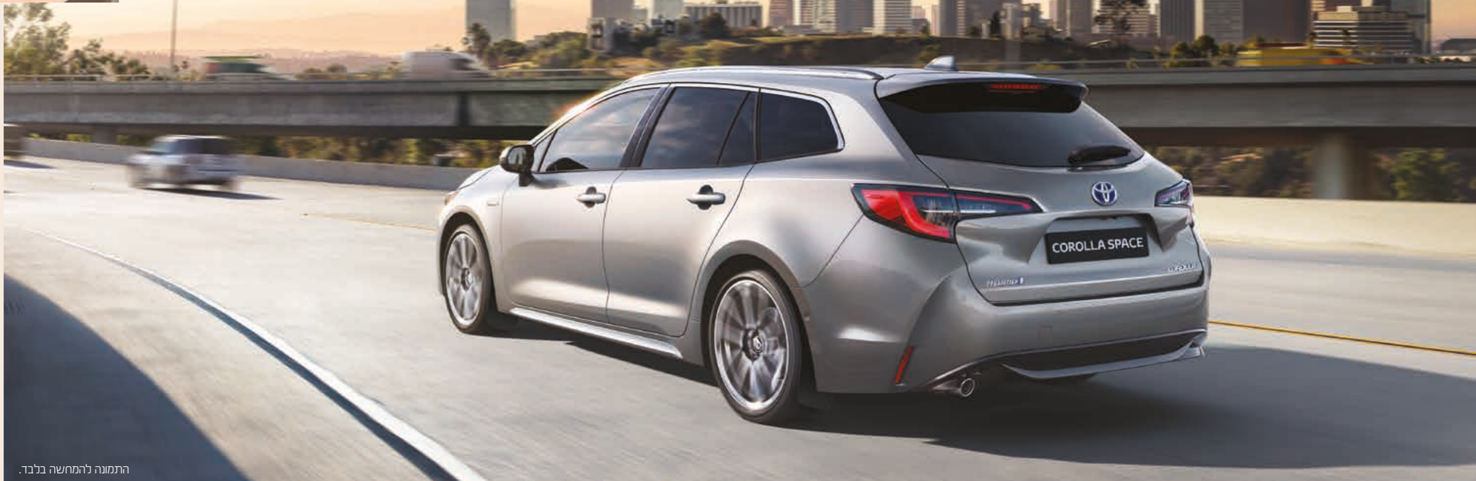
התמונה להמחשה בלבד.

טכנולוגיית Hybrid Synergy Drive® משלבת בין שני מנועים, מנוע חשמלי ומנוע בנזין בנפח 1.8 ליטר, כדי לבחור את מצב הנהיגה האופטימלי ולהעניק חוויית נהיגה מושלמת. טכנולוגיית Hybrid Synergy Drive® מעניקה ביצועים יוצאי דופן ללא פשרות ונתוני צריכת דלק מרשימים.