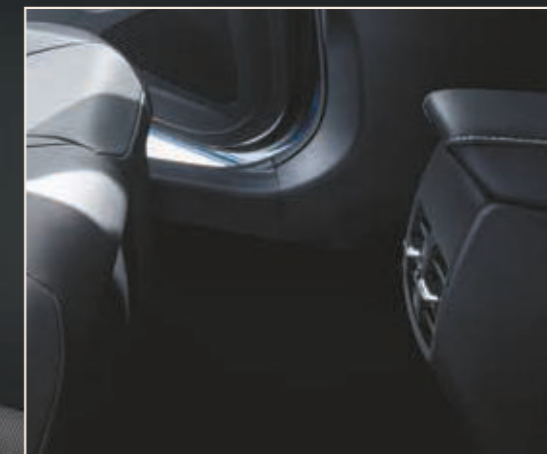
פתחי מיזוג אחוריים ליושבים במושב האחורי