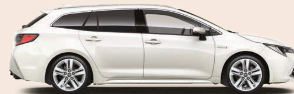
לבן פנינה מטאלי 070