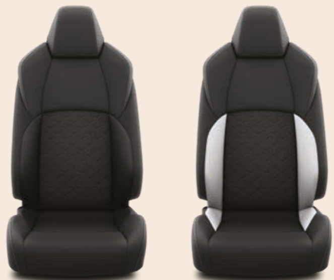
שחור בשילוב אפור* / ריפוד בד שחור

*ריפוד בד שחור בשילוב אפור מגיע בצבעים חיצוניים לבן פנינה מטאלי ושחור נאר מטאלי בדגם ה- SPACE+ בלבד