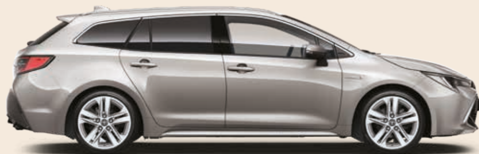
כסוף יוקרתי מטאלי 1J6