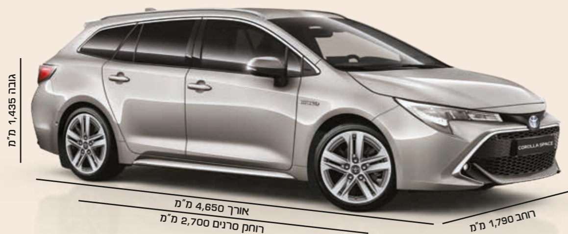
התמונה להמחשה בלבד.