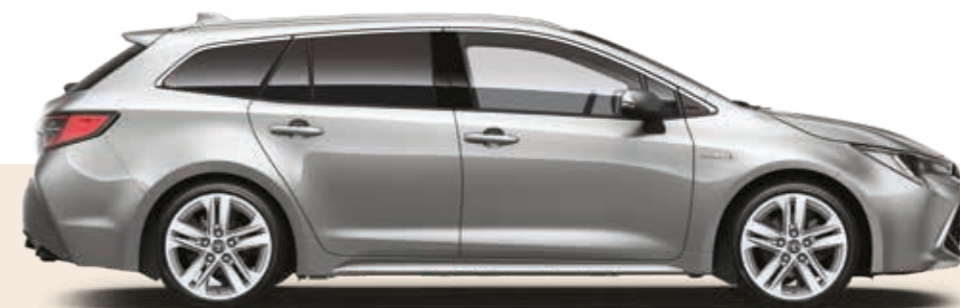
כסוף מטאלי 1F7