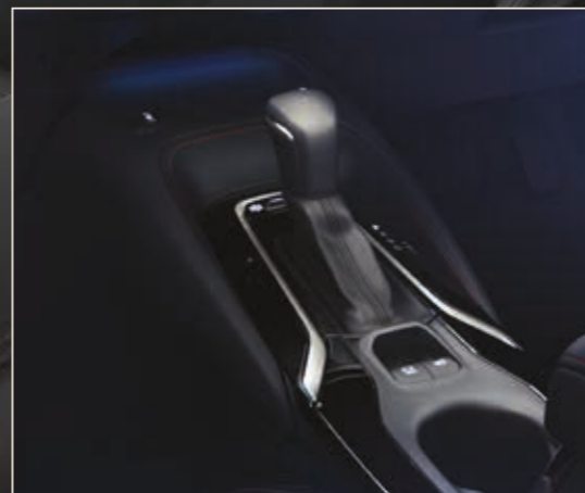
משטח טעינה אלחוטית לטלפון נייד*