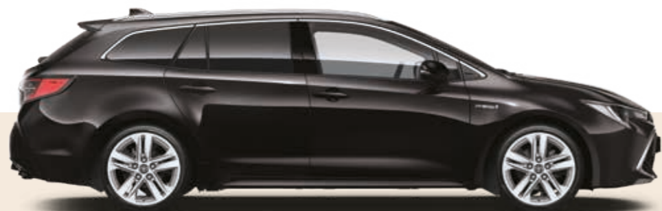
שחור נואר מטאלי 209