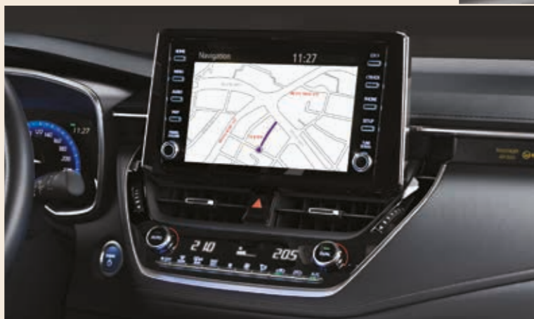
מערכת מולטימדיה "8" דוברת עברית הכוללת ניווט WAZE