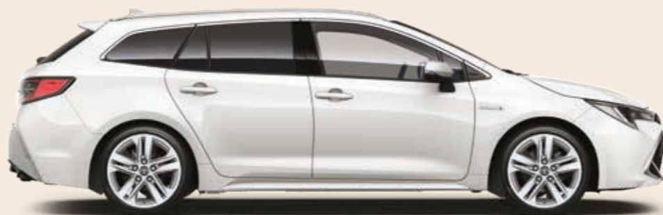
לבן צחור 040