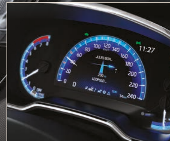
מסך נתונים "7 צבעוני בלוח המחוונים"