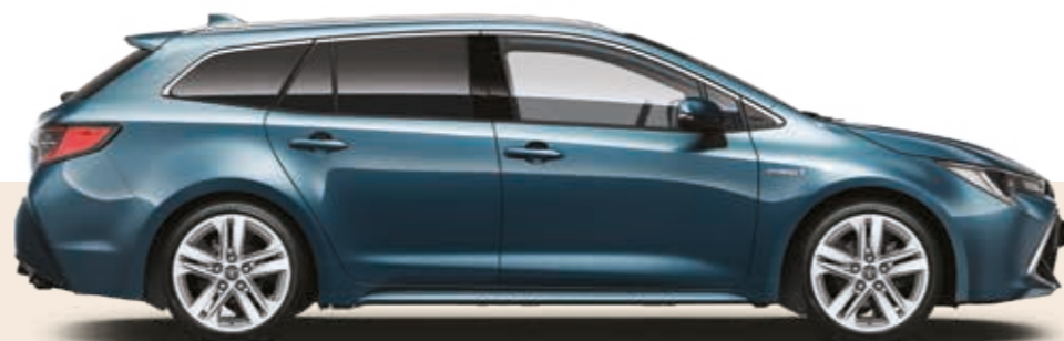
כחול מטאלי 806