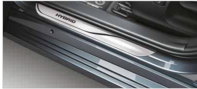
קישוט סף דלת מאלומיניום