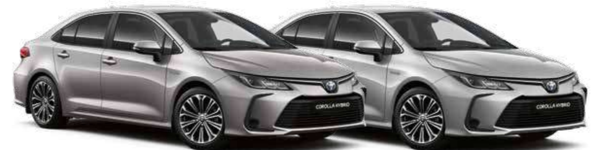
אפור מתכתי מטאלי 1א0