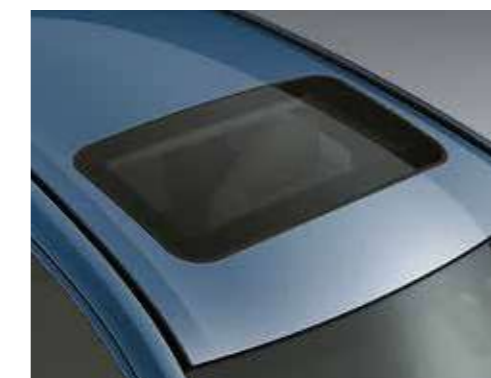
חלון שמש נפתח חשמלית (Sunroof)**