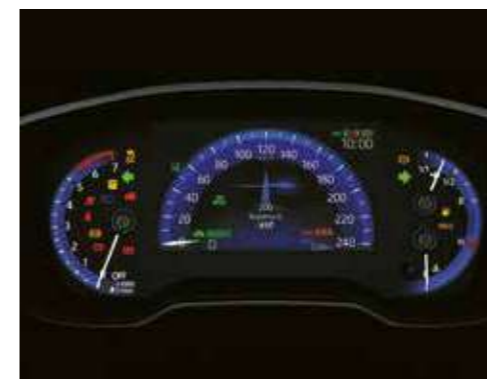
מסך נתונים צבעוני בלוח המחוגים 7"