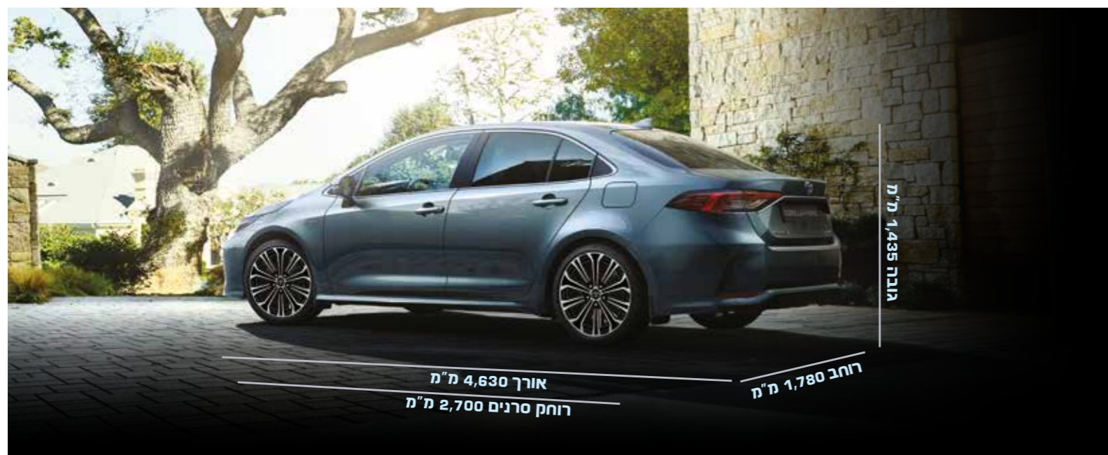
התמונה להמחשה בלבד.