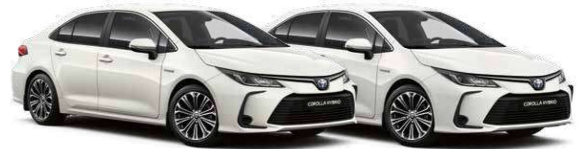
לבן צחור 040