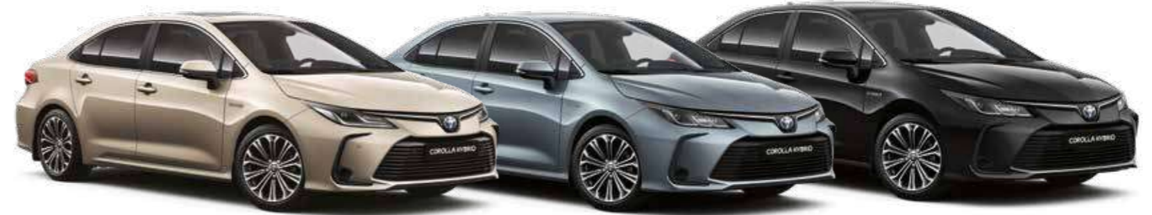
בז' מיקה 587