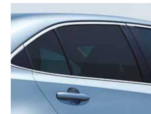
שמשות אחוריות כהות**

*מערכת המולטימדיה בדגם LIMITED הינה מערכת מקורית, וגודל המסך שלה הינו 8". **זמין בחלק מרמות הגימור. התמונות להמחשה בלבד