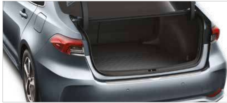
אמבטיה לתא מטען