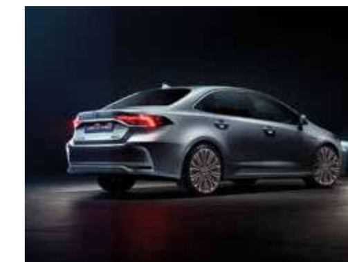
כיבוי תאורה מושהה FOLLOW ME HOME