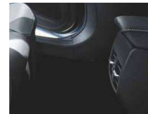
פתחי מיזוג אחוריים ליושבים במושב האחורי