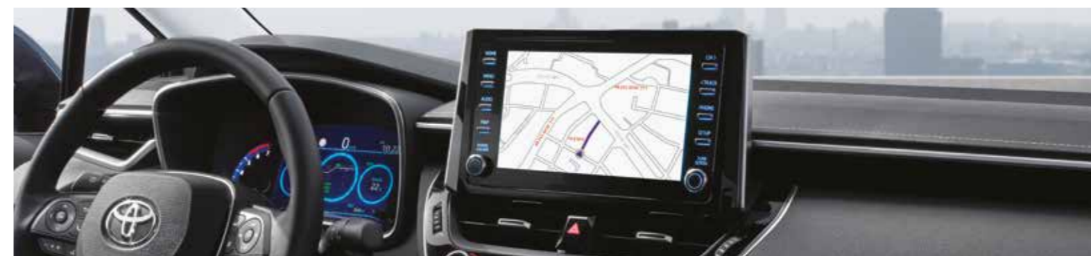
מערכת מולטימדיה בהתקנה מקומית ומסך 9"