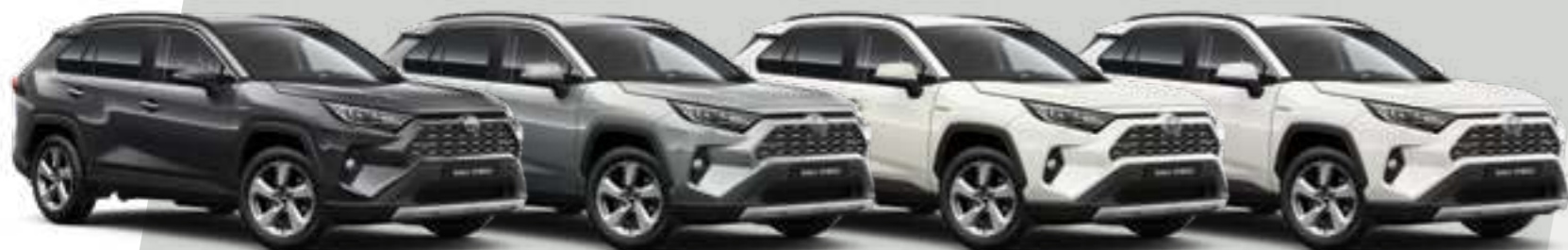
אפור כהה מטאלי 1G3