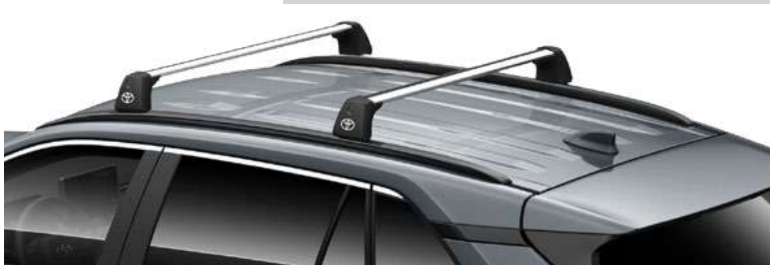
מוטות רוחב - לדגמי בנזין בלבד