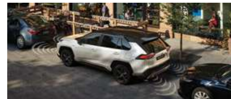
חיישני חניה אחוריים וקדמיים*