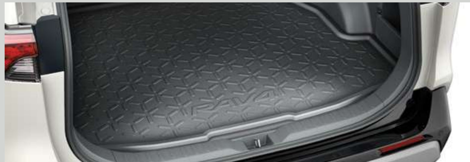
אמבטיה לתא המטען