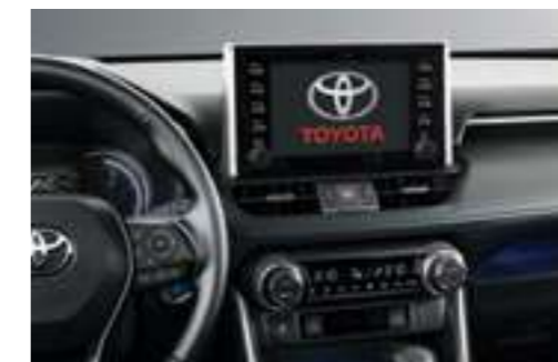
מערכת מולטימדיה "8 דוברת עברית