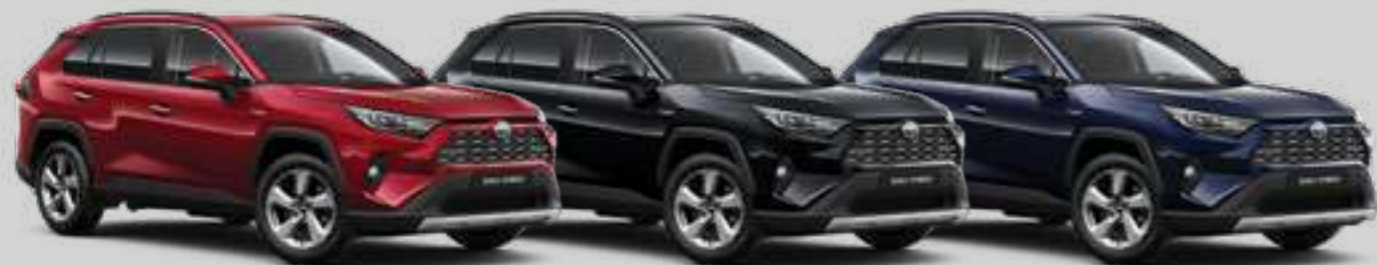
אדום רוז מטאלי 3T3