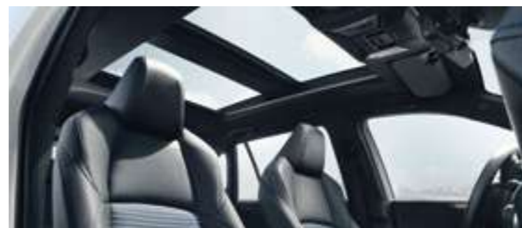
גג פנורמי (Panoramic roof)*

טכנולוגיה חכמה ומחוברת שמעוצבת לפי הדרישות והצרכים שלך