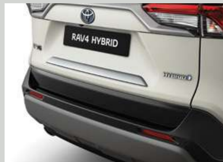
קישוט ניקל לתא המטען