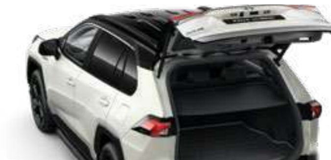
דלת תא מטען חשמלית