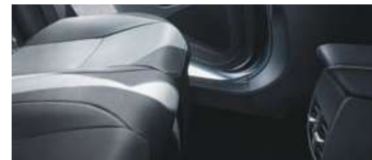
פתחי מיזוג אחוריים ליושבים במושב האחורי