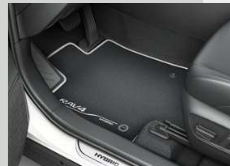
סט קישוט סף לדלתות (לדגמים היברידיים)