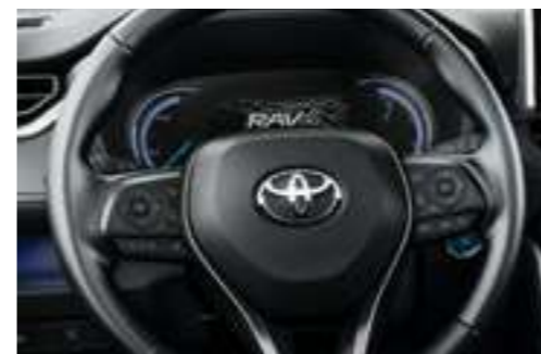
מסך נתונים צבעוני בלוח המחוונים*7